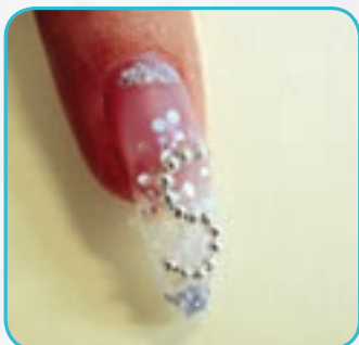
4. Nakładamy cienką warstwę akrylu clear i dodajemy srebrny brokat. Na kolejnej warstwie akrylu, z koralek układamy literkę S. Budujemy paznokcie.