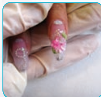
5. Na jednym paznokciu, za pomocą kolorowego akrylu, wykonujemy różę z listkami i dodajemy srebrny bulion. Całość pokrywamy akrylem przezroczystym.