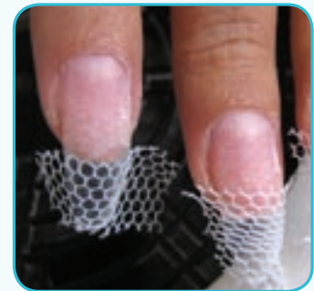
3. Na wolny brzeg paznokcia nakładamy klej do tipsów i naklejamy koronkę. Boki docinamy.