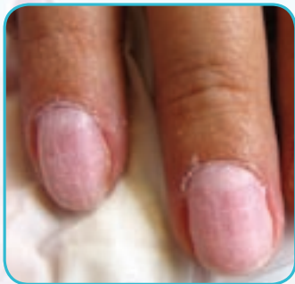
1. Standardowo przygotowujemy płytkę paznokcia.

Akryl przezroczysty, biały, różowy, zielony Ozdoby biała koronka, drobny srebrny brokat, gruby brokat opalizujący, srebrny bulion, koralki srebrne, opalizujące cyrkonie Swarovskiego Flexbrush biały top coat uv